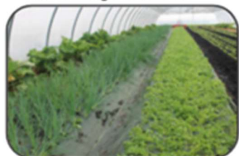
Productions sous serre