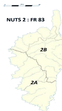
Figure 1: Aire géographique "Lignum Corsica®"

La transformation peut être réalisée par des sous-traitants non certifiés LIGNUM CORSICA : BOIS CERTIFIÉ® suivant les conditions définies au paragraphe 2.6 : « Les cas de sous-traitance ».